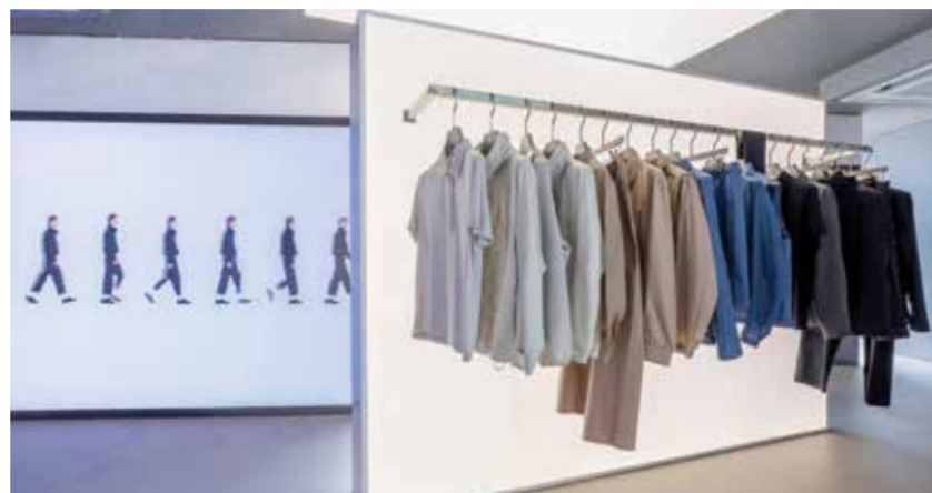
波司登将以北影节官方指定时尚功能服饰的身份登场。

为什么是波司登？因为在北影节的视角下，中国品牌需要一种“国际化的东方表达”。波司登通过专业功能性的技术积淀，与北影节的艺术高度形成对位。在即将到来的大秀上，波司登不仅是展示者，更是北影节这一文化叙事中的重要“演职人员”，它将用现代设计的创新，演绎传统美学的时代新生。