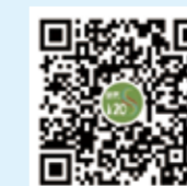
纺织 120S 微信视频号