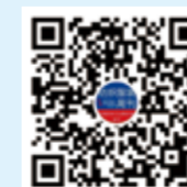
纺织服装周刊 微信视频号