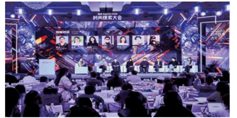
大会带来对时尚与产业的又一次深度探索。

们能批发出去多少货”转向“我们能帮客户赚多少钱”，而变革的核心在于商业模式的彻底变革、组织架构的根本重塑、集团平台的赋能体系。他分享道，为实现转型，安正时尚集团通过“转向授权、监督与赋能，事业部独立经营决策，研发营销全价值链一体化”，进行了企业组织架构的根本重塑。