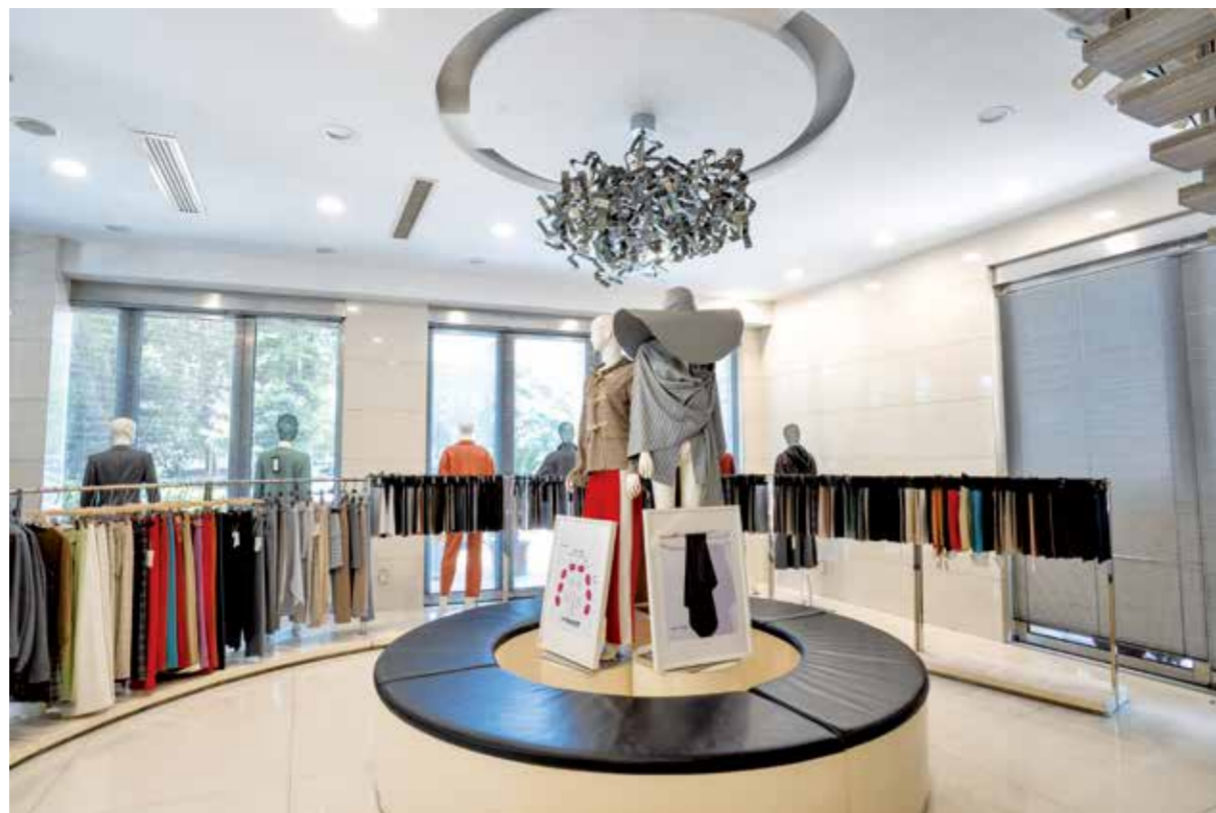
柯桥纺企走出了一条既降成本又增效的稳健发展之路。