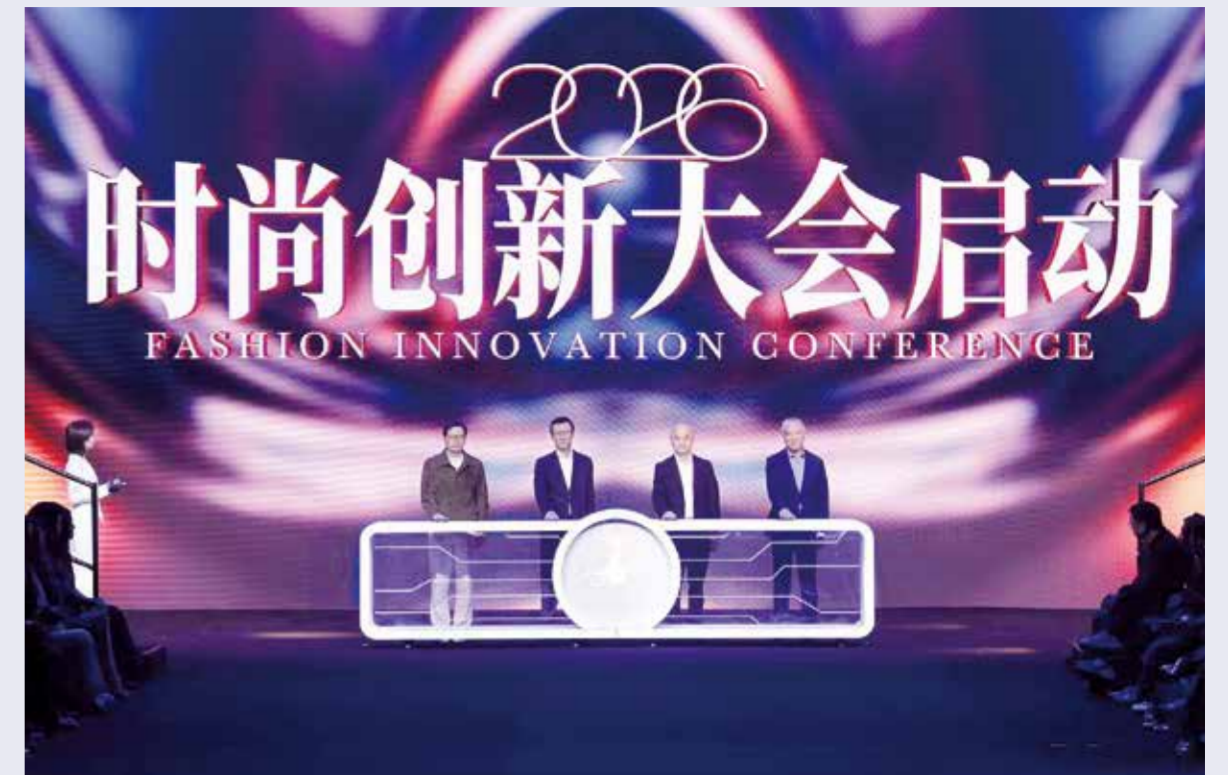
海宁中国皮革城正从“中国皮都”蜕变为“秋冬时尚策源地”。