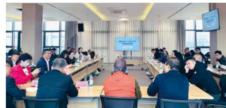
专家、企业、商户共同探讨弹性面料未来。

近日，“弹性面料产业链沙龙暨产品专场对接会”在中国轻纺城纺织新材料中心举行。本次活动吸引了行业专家、市场面料经营户、产业链上下游企业代表及品牌方近200人参与，聚焦弹性面料的技术创新与市场应用，试图打破行业对弹性面料的传统认知。