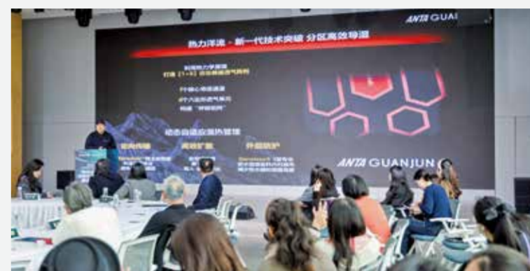
百位设计师深度交流。