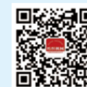
纺织机械 微信公众号