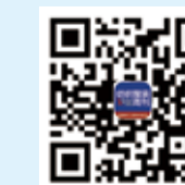
纺织服装周刊 新浪微博