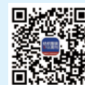
纺织服装周刊 微信公众号