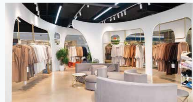
海宁中国皮革城打造集购物、休闲、体验于一体的商贸新空间。