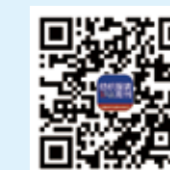
纺织服装周刊 今日头条号