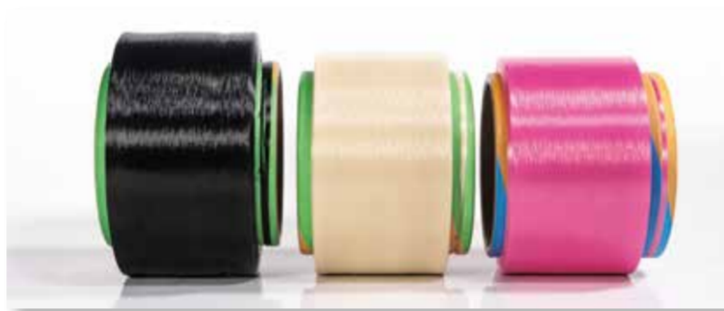
爱净纶实现抗菌、抑臭、消臭三位一体功能。

相较于传统抗菌锦纶与金属离子抗菌纤维，爱净纶的创新亮点直击行业痛点，构建起难以复制的核心壁垒。其最突出的优势便是安全无刺激，抗菌材料采用非溶出设计，不迁移、不渗透，通过人体细胞无毒性检测，完美适配母婴、孕妇、老年人、敏肌等全人群使用。同时，爱净纶打破功能割裂的行业困境，实现抗菌、抑臭、消臭三位一体，经国标、美标、ISO 等多项权威检测，抑菌效果显著，抑臭功能突出。此外，产品具备超强耐洗性，反复洗涤后功能依旧稳定，解决了传统纤维“短效易衰减”的难题，再加上生物基含量认证，绿色环保属性契合全球可持续时尚趋势，让安全与环保并行不悖。