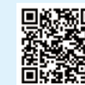
纺织服装周刊 网易号